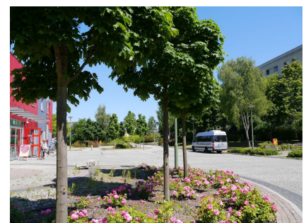
Zufahrt auch für den Behinderten-Fahrdienst