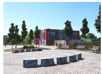
Der Stadtplatz am Haus Kompass