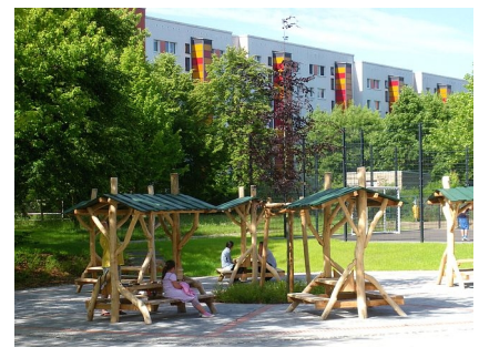
Die neuen Sitzplätze der Cafeteria

2004 (Sportflächen) u. 2012 (Südwestlicher Hof)