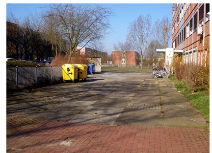
Der rückwärtige Schulhof vor Projektbeginn