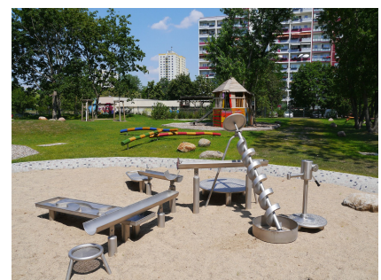
Wasserspielplatz im Freizeitgarten