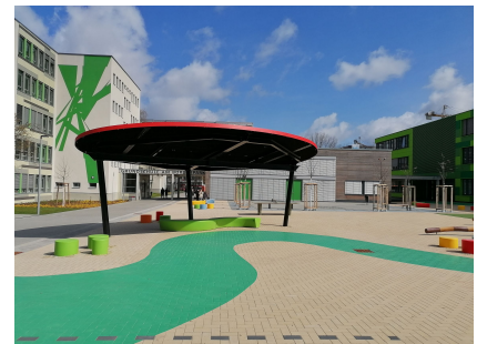
Pavillons, Sitz- und Balancierelemente und farbige Markierungen auf dem Pflaster prägen die Gestaltung