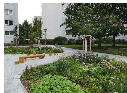
Attraktive Pflanzungen und Bewegungselemente an den Wegen