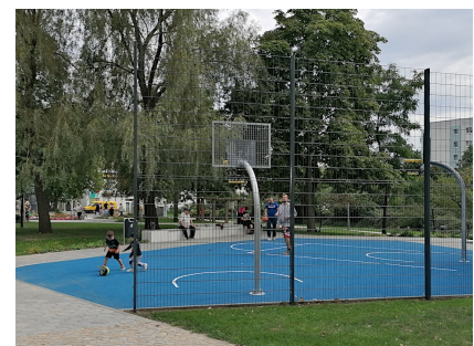
Zwei neue Sportflächen wurden in den Park integriert