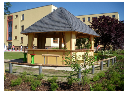
Der Pavillon bietet Ausschankmöglichkeiten für Feste

Sportplatz - 2010, Schulhof u. Vorplatz: 2012 bis 2013