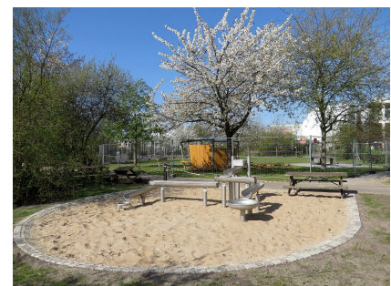
Der neue Wasserspielplatz