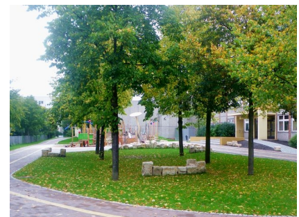
Neben dem Spielbereich gibt es viel Grün auf dem Schulhof für die Jüngsten