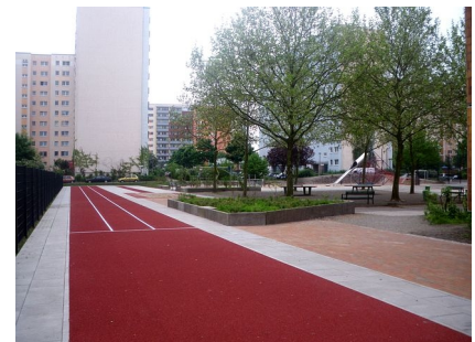
Leichtathletikanlagen und der Schulhof für die Größeren