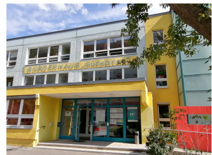
Das Bürgerhaus Südspitze wurde im Rahmen des Stadtumbaus bereits barrierearm umgestaltet