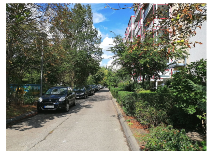
In vielen Wohnstraßen fehlen Gehwege und Bordsteinabsenkungen