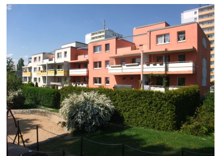
Dazu gehören auch Mietergärten und Spielplätze