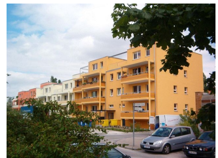
Ein attraktives Stadtquartier ist entstanden