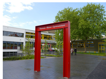
Auch Zugangsbereiche vor dem Thomas-Mann-Gymnasium und dem Bürgeramt wurden erneuert