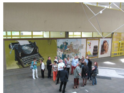
Die zentrale Halle des Gymnasiums ist nun besser isoliert