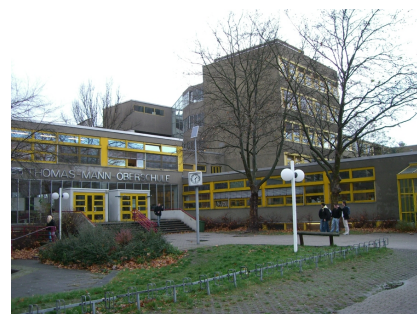
Die Thomas-Mann-Oberschule vor Projektbeginn mit zweigeteiltem Haupteingang