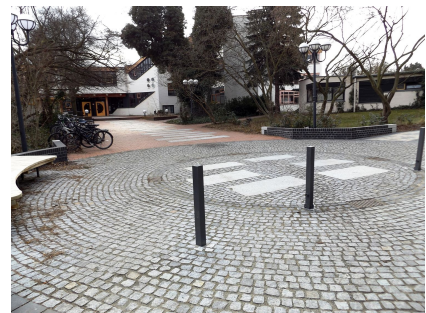
Eingangssituation der Jugendkunstschule Atrium am westlichen Zugang zum Mittelfeld