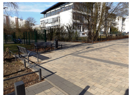
Aufenthaltsplatz am erneuerten Nordzugang zwischen Seniorenzentrum, Oberschule und Mittelfeldbecken