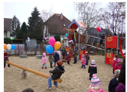
Mit einem Kinderfest wurde der Spielplatz eingeweiht.