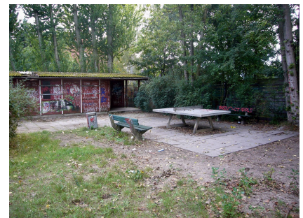
Zustand des Platzes vor der Neugestaltung. Im Hintergrund das marode Holzhaus