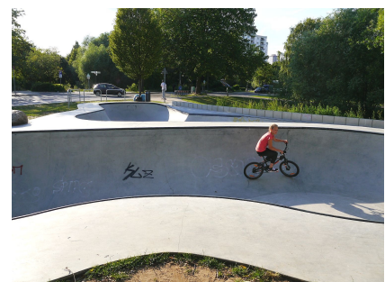
Die neuen Betonrinnen stellen hohe Anforderungen an das Können der FahrerInnen