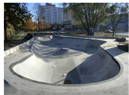
Auch die Erweiterung wurde mit den Nutzenden abgestimmt