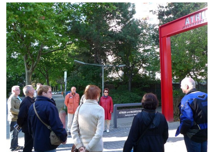
Der Quartiersbeirat besichtigt regelmäßig die laufenden Projekte