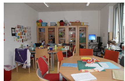
Neue Erzieherbereiche in der Märkischen Grundschule