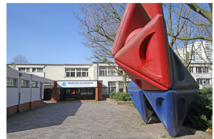
Der Eingangsbereich der Märkischen Grundschule