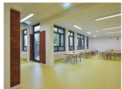
Die Mensa wurde großzügig erweitert