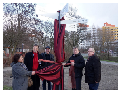
Feierliche Enthüllung im Februar 2016