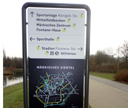
Eines der 11 Informationsschilder