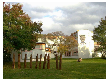
Der Kunstpark 2014