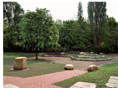
Ein Ort zum Flanieren und Entspannen mit viel Platz für Werke junger Künstlerinnen und Künstler