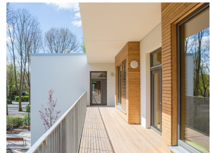
Auf der Gartenseite können die Gruppen einen umlaufenden Balkon nutzen.