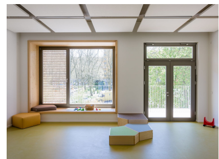
Helle Materialien und große Glasflächen sorgen für viel natürliches Licht.