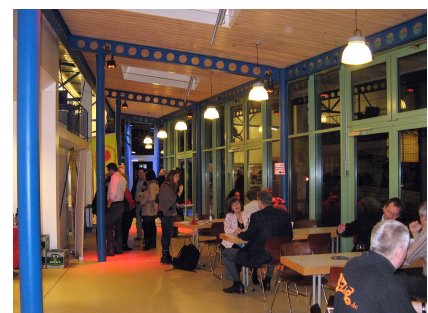
Im neuen Veranstaltungsraum