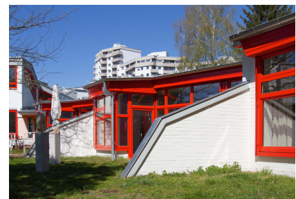
Das charakteristische Sichtmauerwerk blieb erhalten