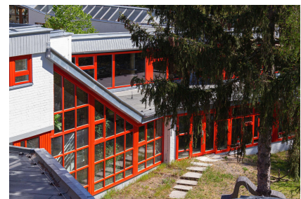
Die Architektursprache der 1960er Jahre ist bei der energetischen Sanierung eine lohnende Herausforderung