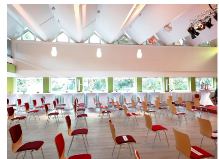
Der Gemeindesaal wurde zum architektonisch und technisch bestens geeigneten Mehrzwecksaal umgestaltet