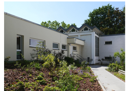
Das Integrations- und Familienzentrum der Apostel-Petrus-Gemeinde erhielt einen Anbau