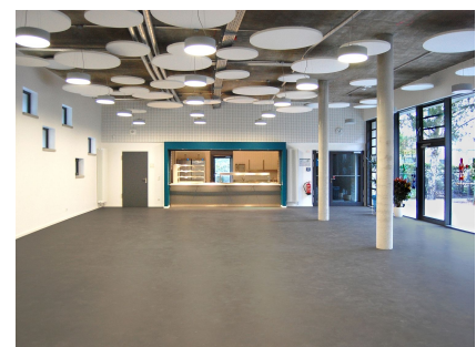
Die großzügige Mensa