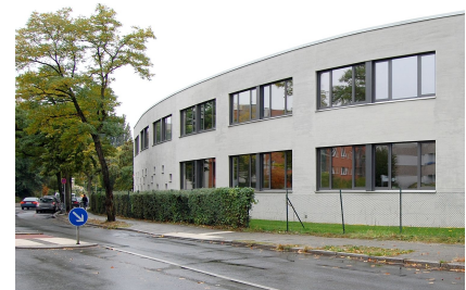
Der Erweiterungsbau am Dannenwalder Weg