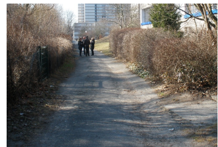
Maroder Wegebelag vor Projektbeginn