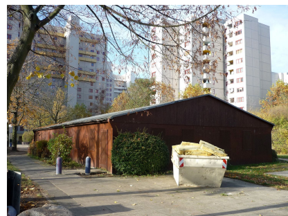
Das Gebäude vor Beginn der energetischen Sanierung