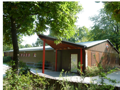
Das CVJM-Jugendhaus mit neuen Türen und Vordach