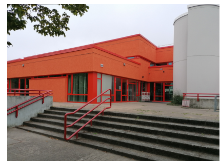
Das comX nach der Sanierung im neuen Farbton