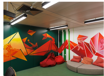
Den Kinoraum gestalteten die Jugendlichen mit.