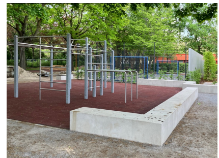
Calisthenics-Anlage im Jugendbereich