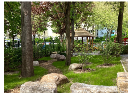
Naturnahe Gestaltung mit neuem Pavillon