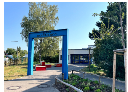
Am Eingang des Oberschulanteils laden neue Sitzmöbel zum Chillen ein