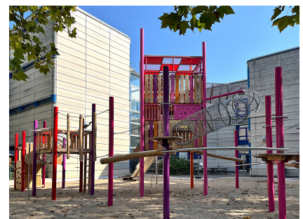
Die neue Kletteranlage für den Grundschulteil