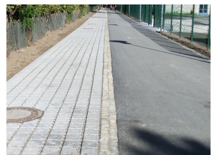
Die Zuwegung zur Schule nach der Umgestaltung