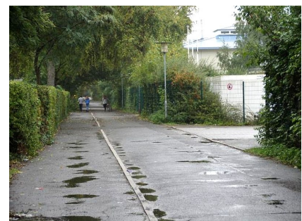
Der Weg zwischen Bettina von Arnim-Schule und Seniorenzentrum vor der Umgestaltung