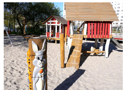
Der neue Bauernhof-Spielplatz für kleinere Kinder