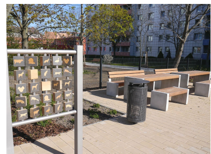
Memoryspiel und Sitzplatz mit Lücke für Rollstühle und Rollatoren