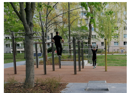
Neu ist u.a. die Calisthenics-Anlage