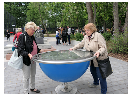
Das Kugellabyrinth erfordert Geschick und Kraft