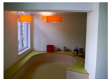
Aus der Küche wurde ein neuer, vielfältig nutzbarer Raum mit Kuschecke