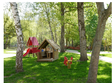
Die Freifläche wurde neu strukturiert und mit zusätzlichen Angeboten aufgewertet