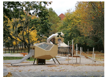
Der Spielplatz "Universum, Raum und Zeit" mit Spielgeräten für verschiedene Altersgruppen