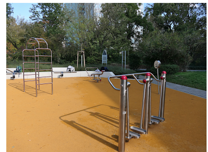
Eine Fitness-Insel mit robusten Geräten ist neu entstanden