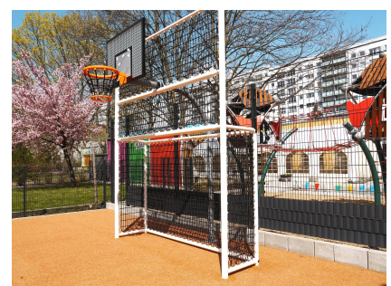
Eines der neuen Bolzplatztore hat einen Basketballaufsatz