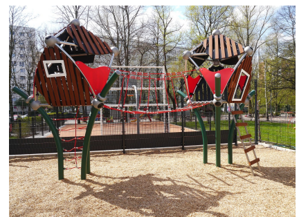
Das Klettergerät "Baumhaus" auf dem neu gestalteten Außengelände des Schülerladens