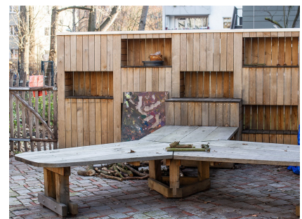
Holzregal mit Werkttisch im Familiengarten