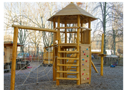
Kletterparcours im Kitagarten