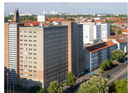
Blick auf den abgeschirmten Block an der Frankfurter Allee