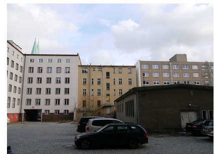
Das Blockinnere ist stark versiegelt. Die Bebauung erscheint stellenweise planlos