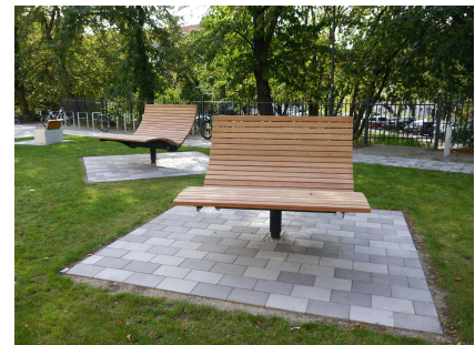
Drehbare Maxi-Sonnenliegen auf der zusätzlichen Pausenfläche