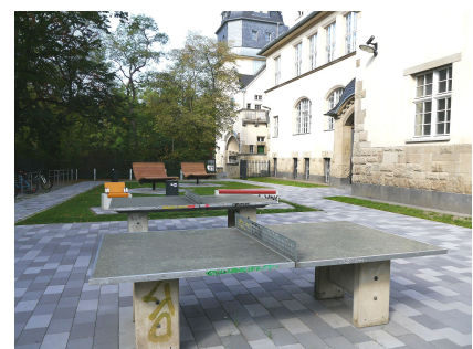
Optimal genutzter Platz zum Chillen und Tischtennis spielen