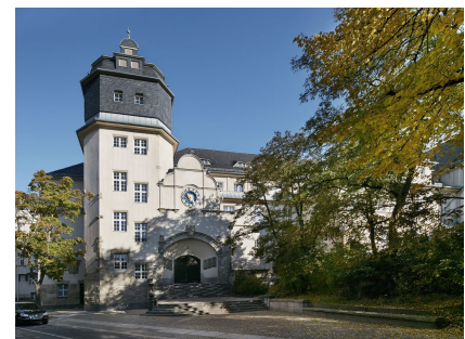
Zur Wiederherstellung des historischen Bildes ist noch die Sanierung der Freitreppe nötig