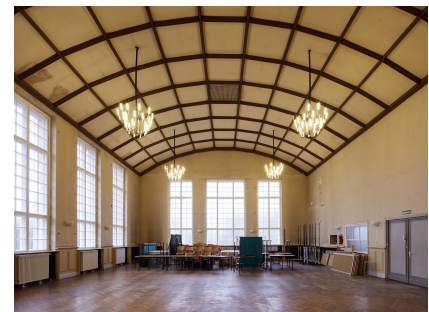
Die historische Aula vor der Sanierung