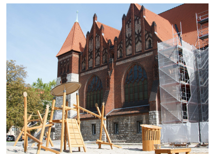
Der neue Spielplatz an der Koptischen Kirche auf dem Roedeliusplatz