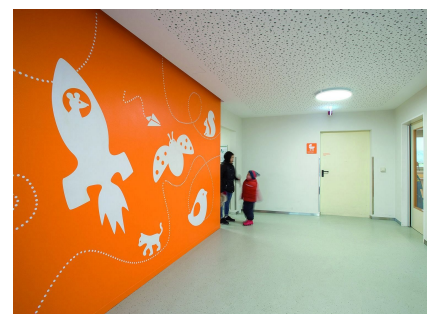
Das großzügige Foyer wurde im kindgerechten Corporate Design des Trägers und der Kita gestaltet