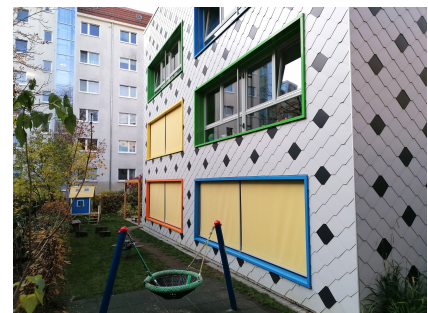
Die markante Fassade ist wärmegeklämt