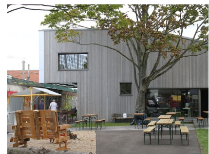
Das Gebäude ragt über die Mauer des Betriebshofes der BVG