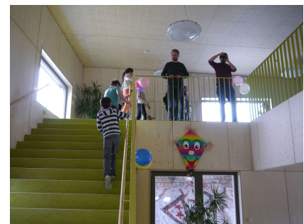
Viel Platz und verschiedene Ebenen mit Ausblick auf das Straßenbahn-Depot