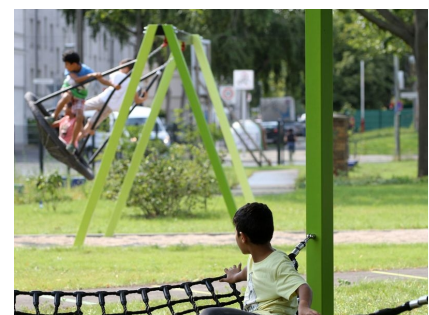
Hängematte und Schaukeln im Garten