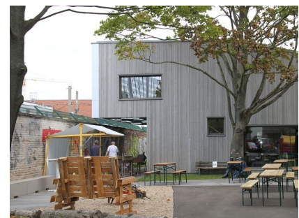
Neben der Terrasse ein Grillplatz mit Selbstbaumöbeln für die Jugendlichen