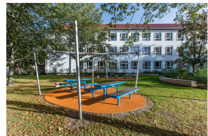
Drei Lerninseln befinden sich zwischen den beiden Schulgebäuden