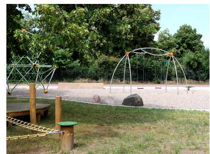
Schulhof mit Chill-Insel, Schaukeln und Klettergerät