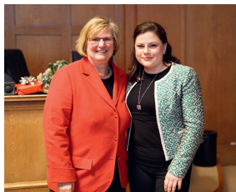
Foto: Frau Schöttler, ehem. Bezirksstadträtin für Stadtentwicklung und Facility Management (links) und Frau Majewski (rechts)

„Ich freue mich, dass ich das zukünftige Gesicht Tempelhof-Schönebergs mitgestalten kann! Mit gutem Bauen werden wir die Liebesswürdigkeit des Bezirks erhalten können.“