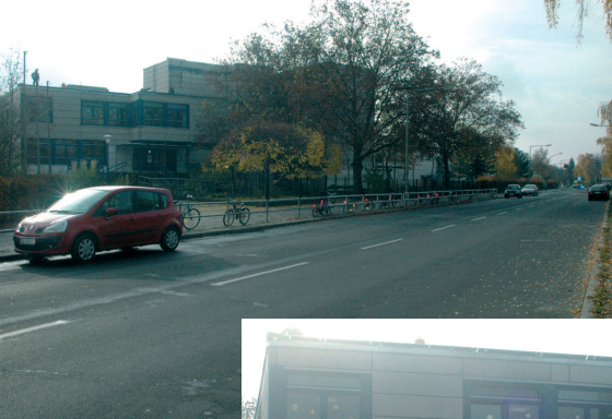
Ansicht Finsterwalder Straße