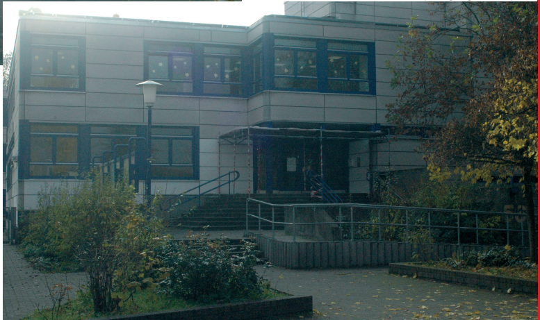
Haupteingang mit Vorplatz