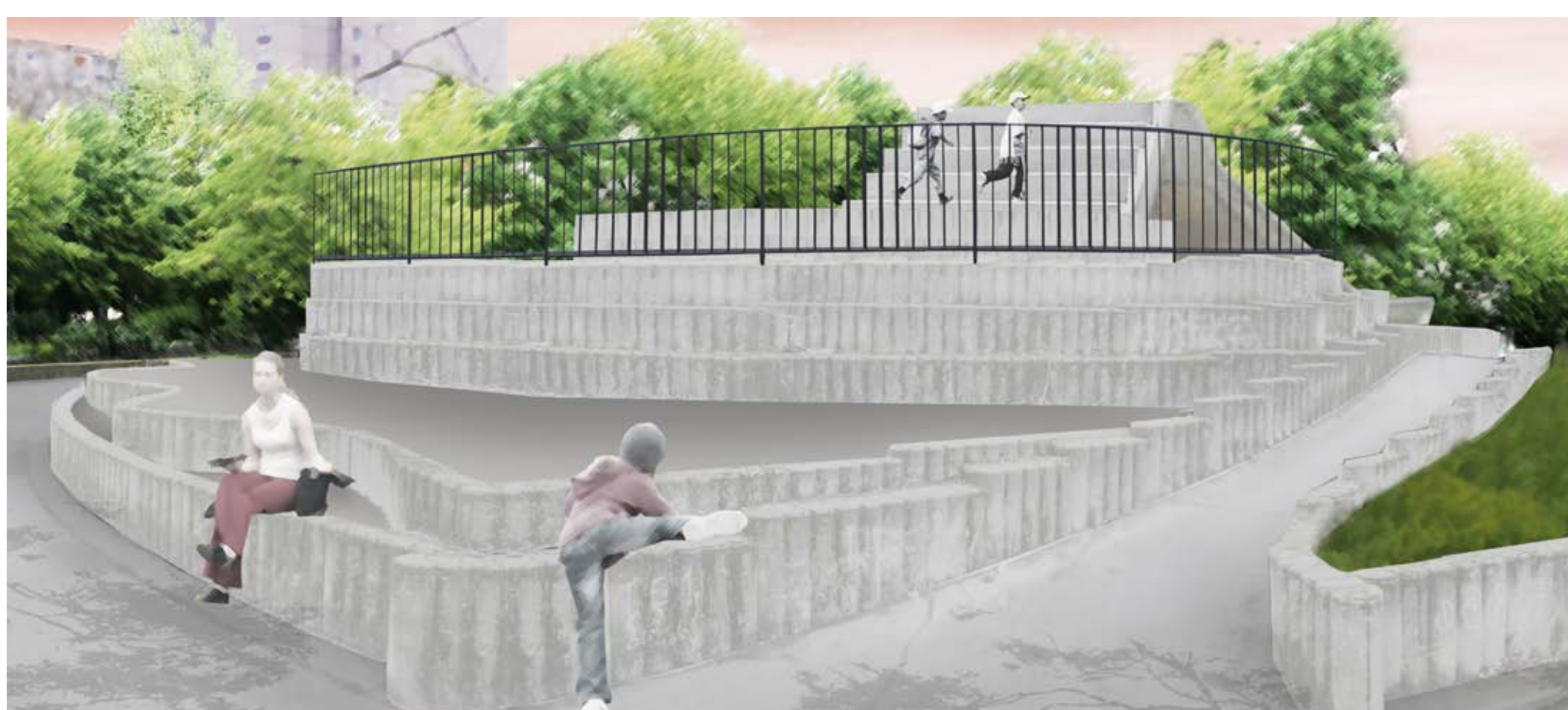
RUTSCHENHÜGEL - KLETTERSEITE (denkmalgerecht saniert)