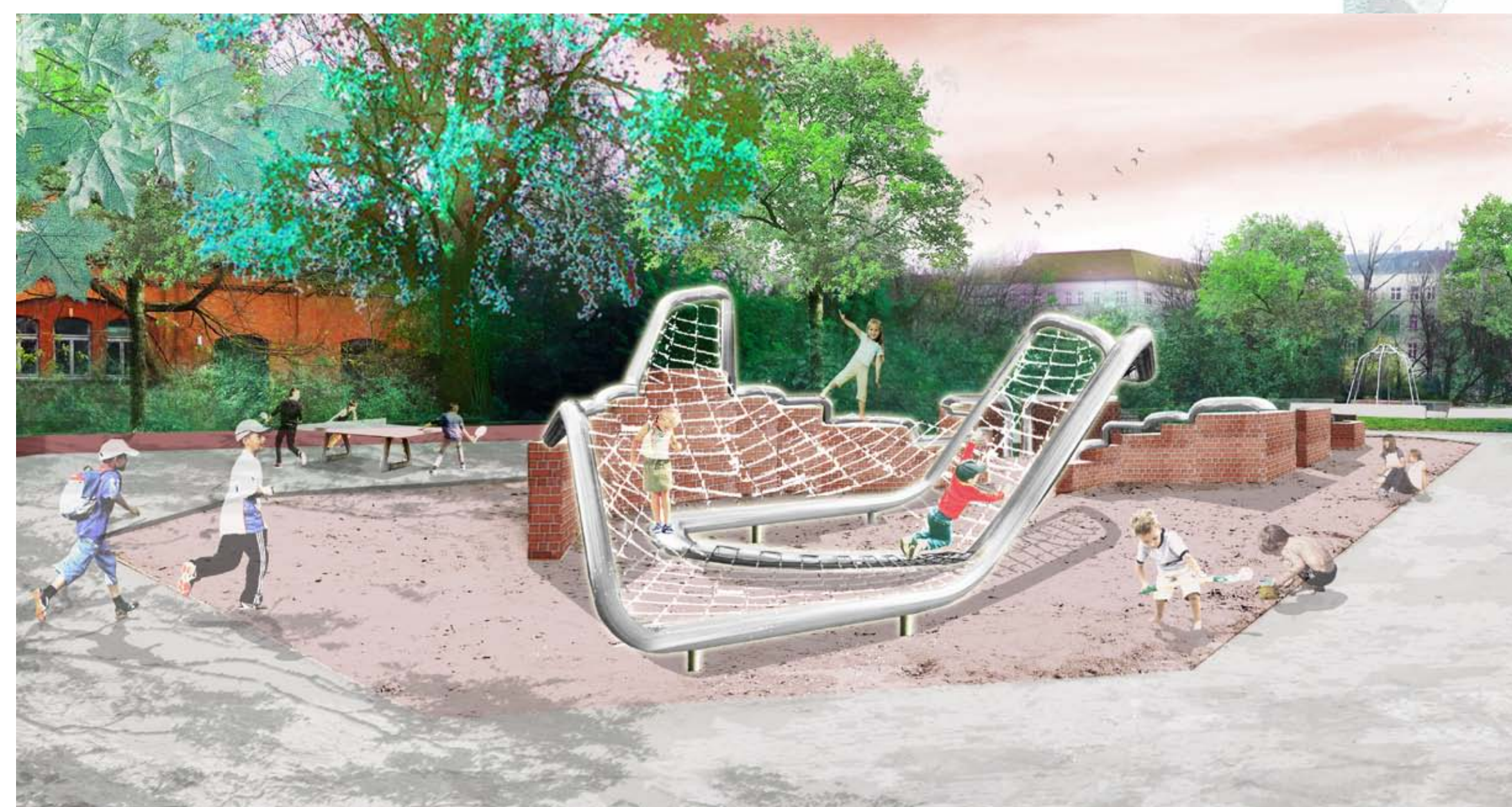
SANDSPIELPLATZ (ein mögliches Klettergerüst als Beispiel)