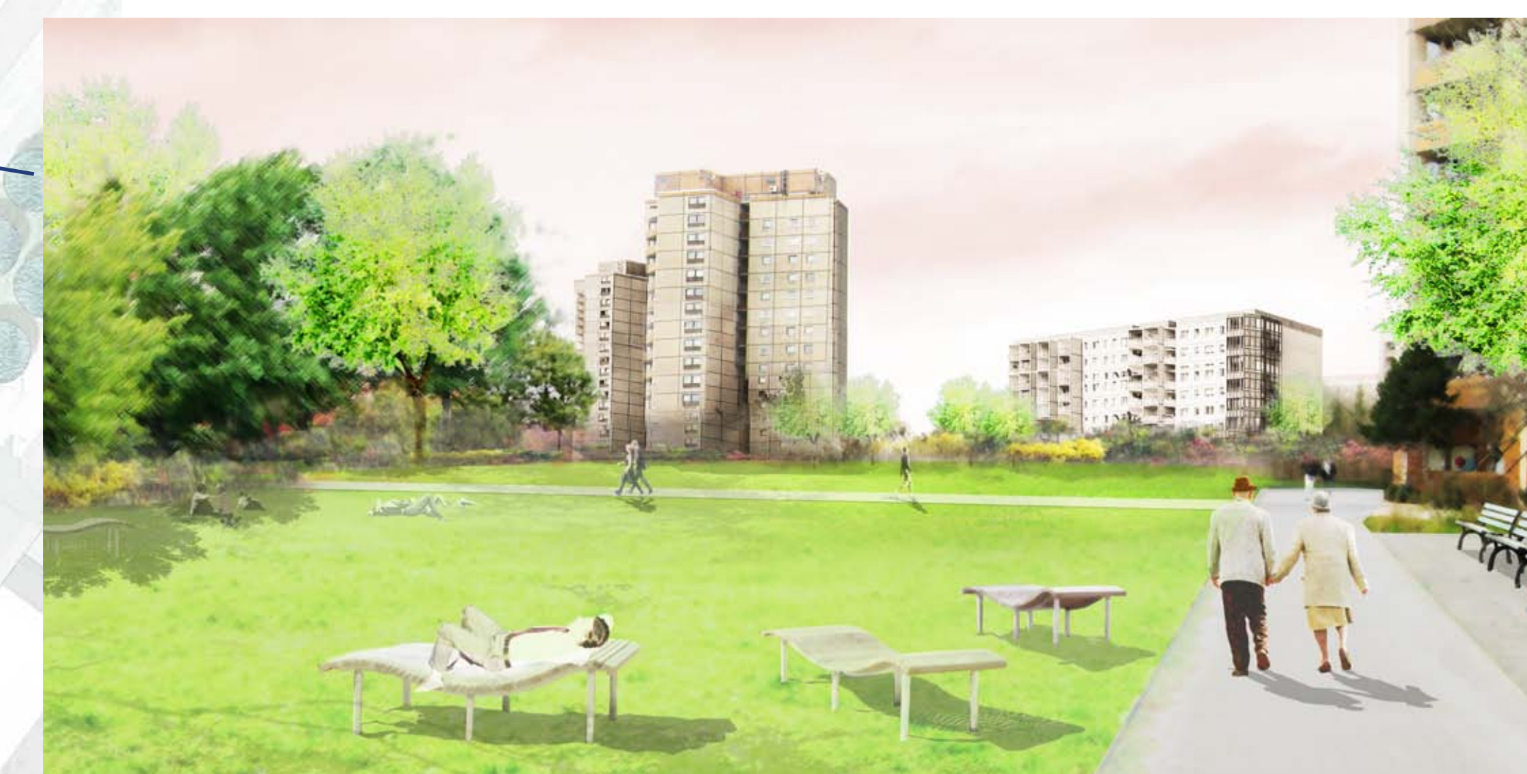
LIEGEWIESE: Sonnenliegen auf der großen Wiese

Konzept: Zwei Seiten werden unter denkmalpflegerischen Gesichtspunkten saniert. Die dritte Seite wird entsprechend der europäischen Norm für Spielplätze und Spielgeräte neu gestaltet. (Vorbild: Berliner Stadtschloss)