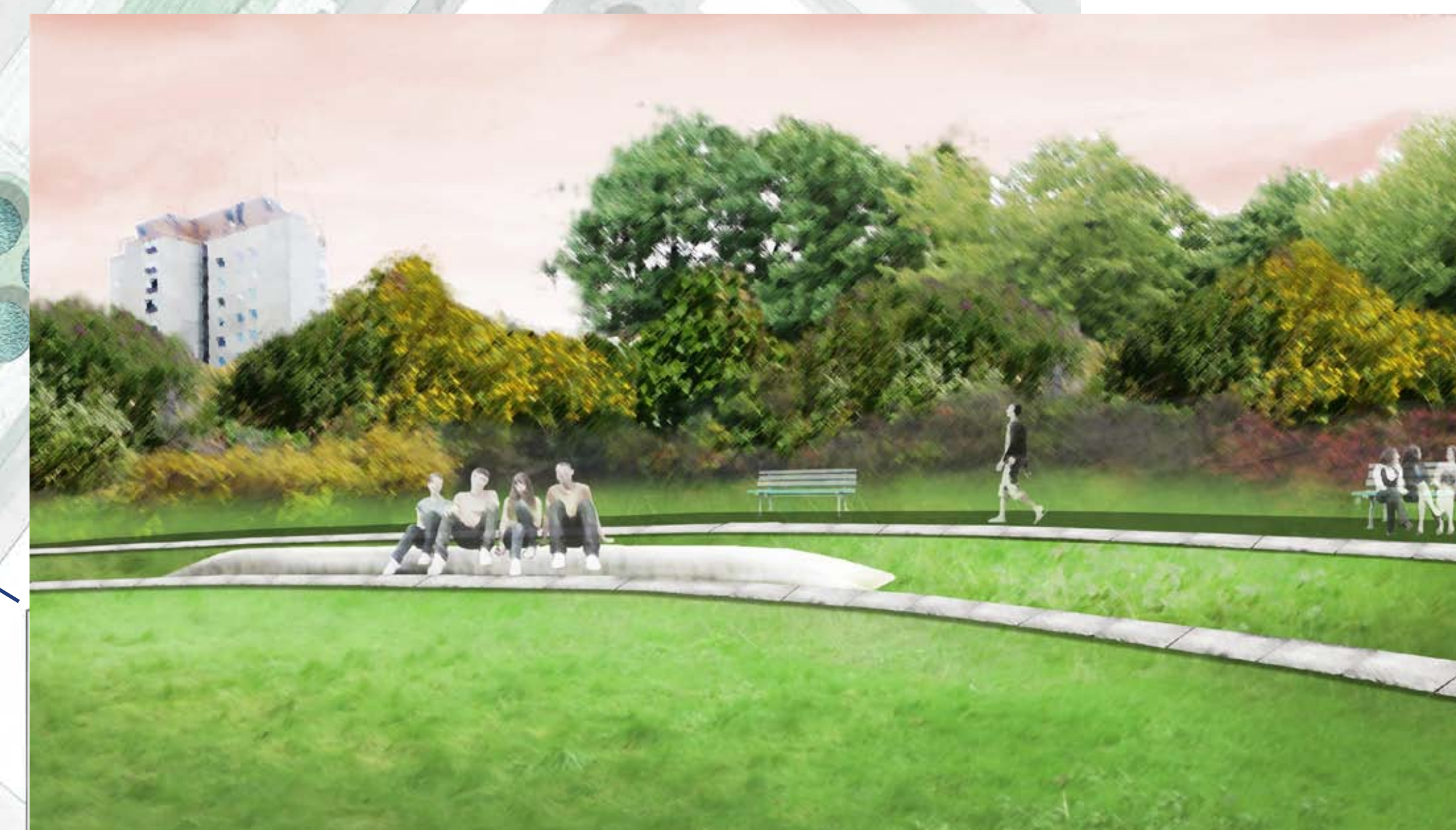
DIMI-WIESE: denkmalgerecht sanierte Wege und ein Platz für Jugendliche