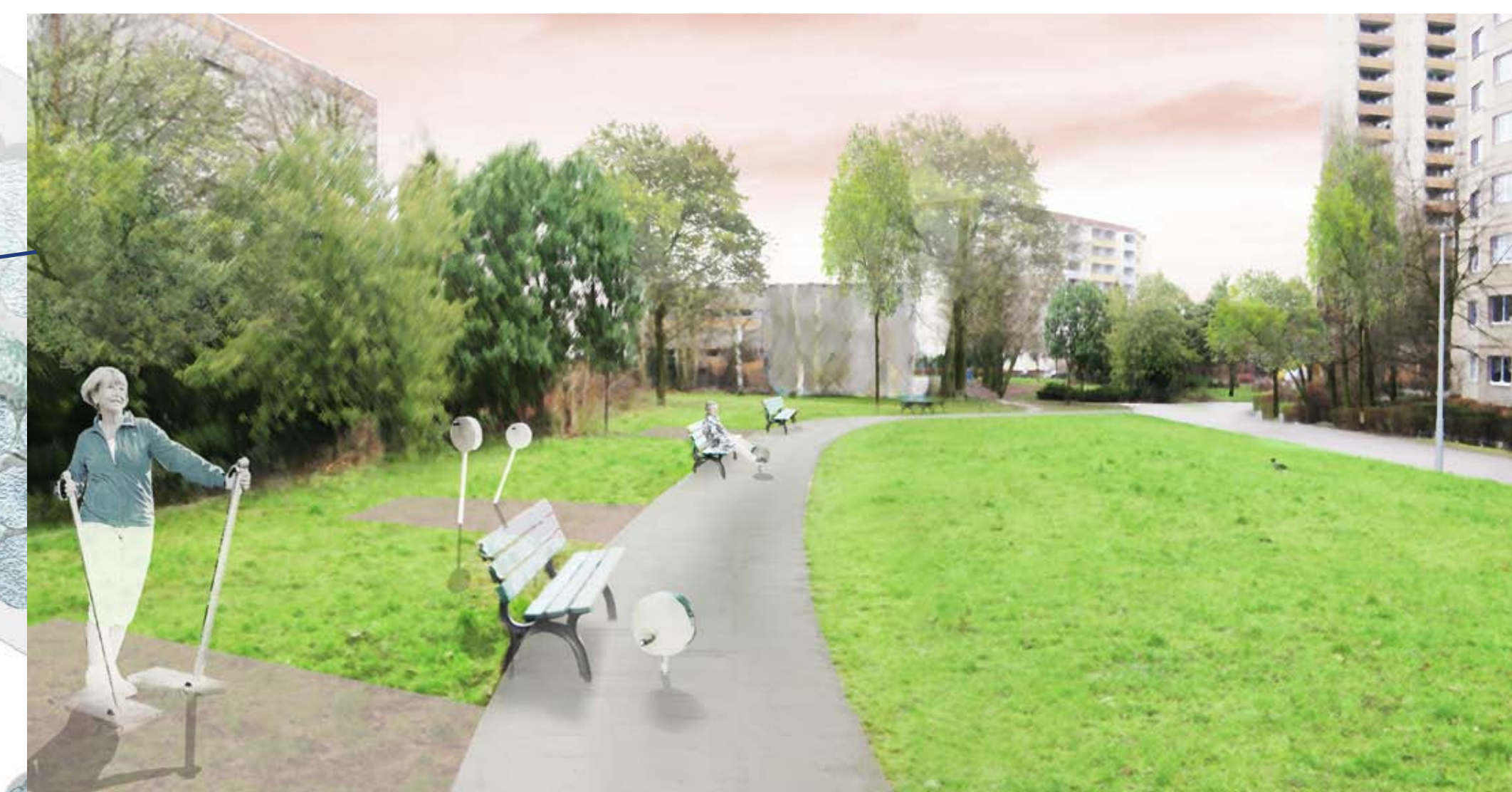
SPORTWIESE: neue Sportwiese mit Fitnessgeräten für Jung und Alt