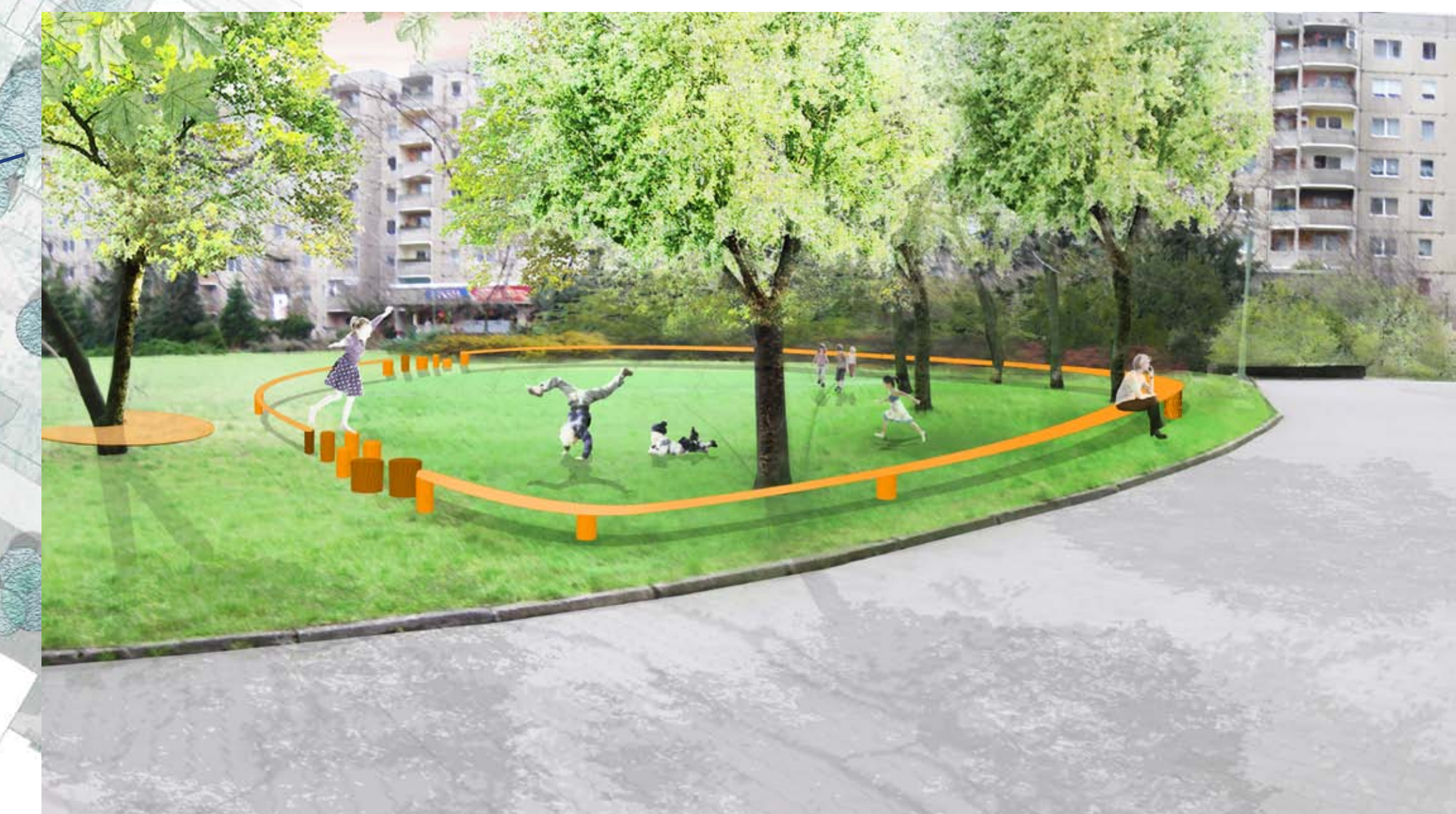
SPIELWIESE: neue Spielwiese mit Balancierparcour als Einfassung (Hundefreie Zone, Nähe zur Kita)