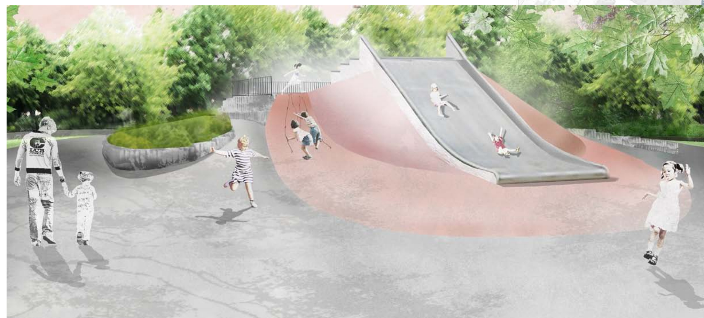
RUTSCHENHÜGEL - RUTSCHENSEITE (neu)

Konzept: Zwei Seiten werden unter denkmalpflegerischen Gesichtspunkten saniert. Die dritte Seite wird entsprechend der europäischen Norm für Spielplätze und Spielgeräte neu gestaltet. (Vorbild: Berliner Stadtschloss)