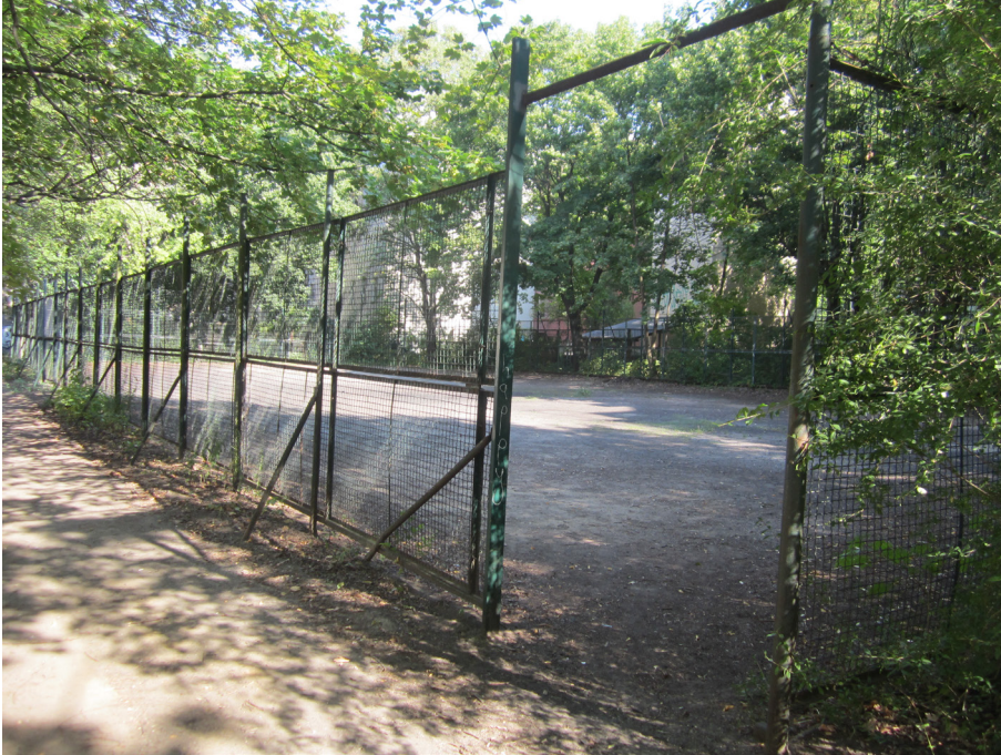
Integrierter Bolzplatz auf dem Spielplatz Dietrich-Bonhoeffer-Straße 22-27, Bestand 2018