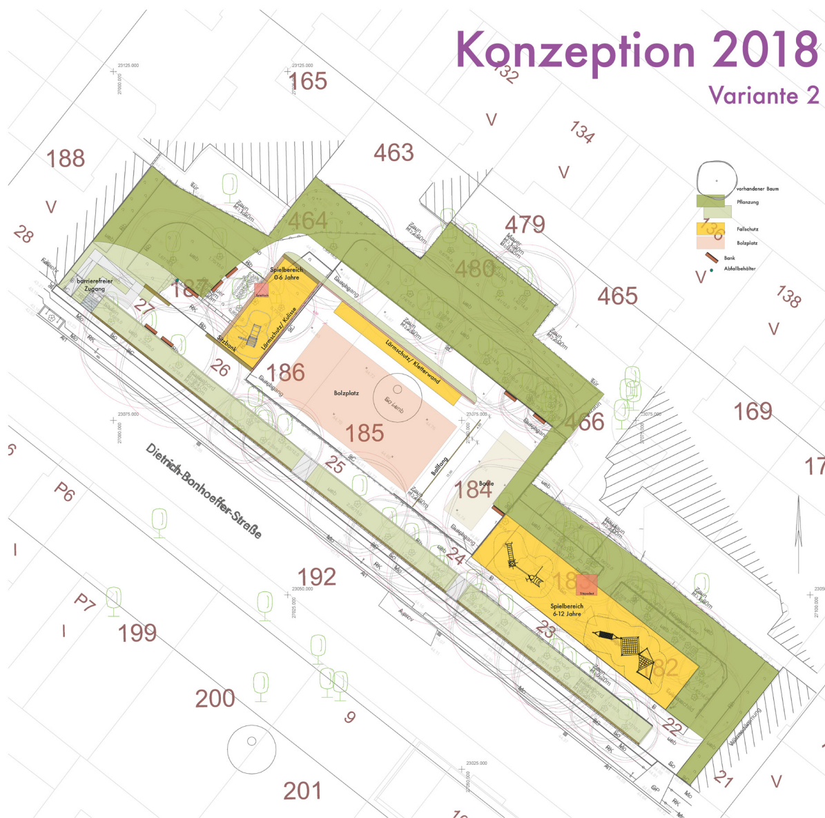
Spielplatzkonzeption, Variante 2 (G+P Planungsgesellschaft mbH 2018)