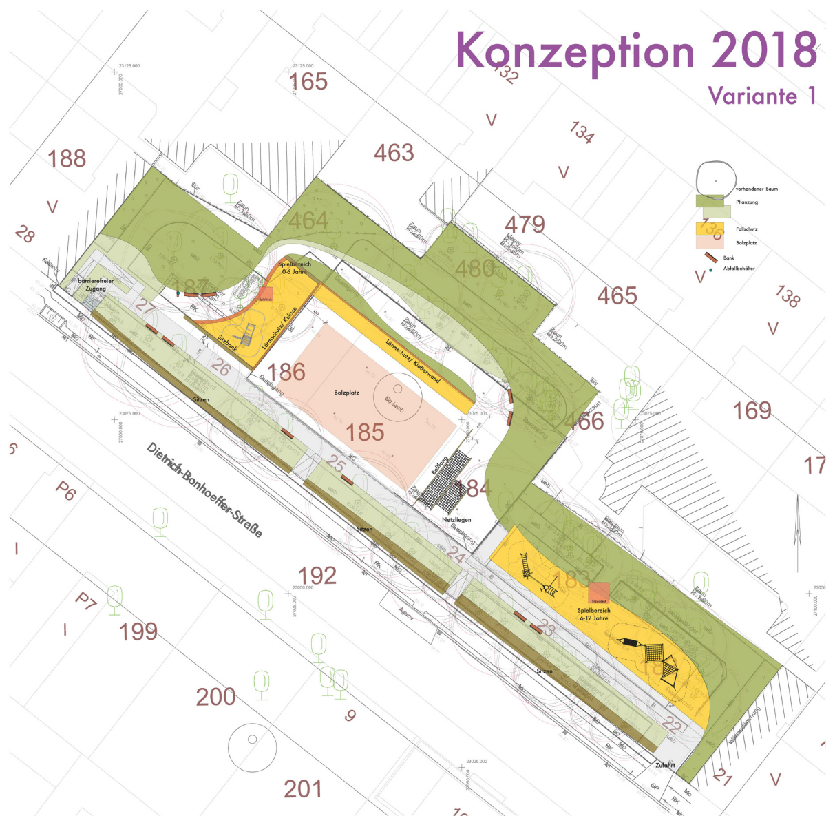
Spielplatzkonzeption, Variante 1 (G+P Planungsgesellschaft mbH 2018)

Am 5. September 2018 um 17 Uhr versammelten sich rund 60 Interessierte aller Altersklassen zur Vorstellung erster Ideenskizzen und diskutieren über Gestaltung und Materialien des Spielplatzes. Herr Holtkamp, Gebietsbeauftragter Stadtumbau Prenzlauer Berg, und Herr Plaasche vom planenden Büro G+P Landschaftsarchitekten erläuterten anfangs die oben genannten Rahmenbedingungen. Anschließend begann direkt an den mit Plänen und Ideenbildern (Kletter-, Sport- und Spielplatzelemente, Bodenbeläge etc.) beklebten Stellwänden die Diskussion aller Anwesenden zur zukünftigen Gestaltung der Fläche.