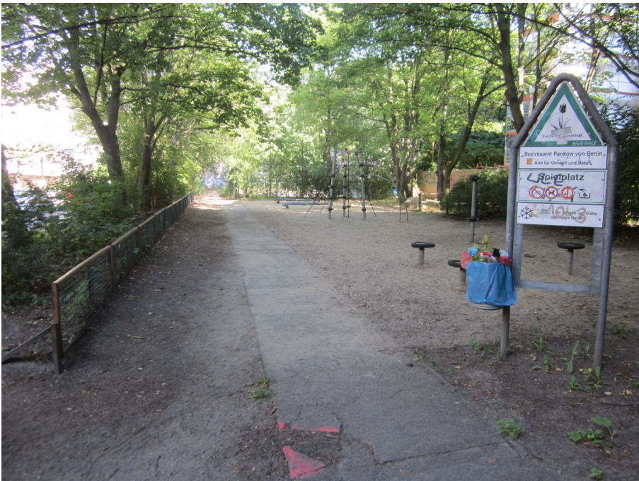
Sandspielplatz, östlicher Teil, Bestand 2018