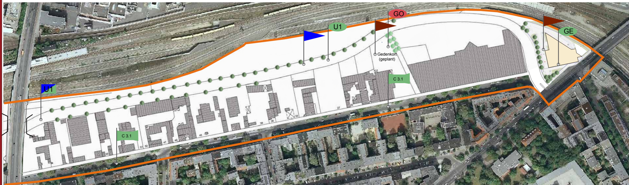
Stadtumbau West - Teilbereich C | östlicher Abschnitt | Bahngewerbegürtel Moabit