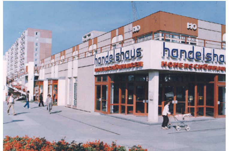
Der Prerower Platz in der 80er Jahren