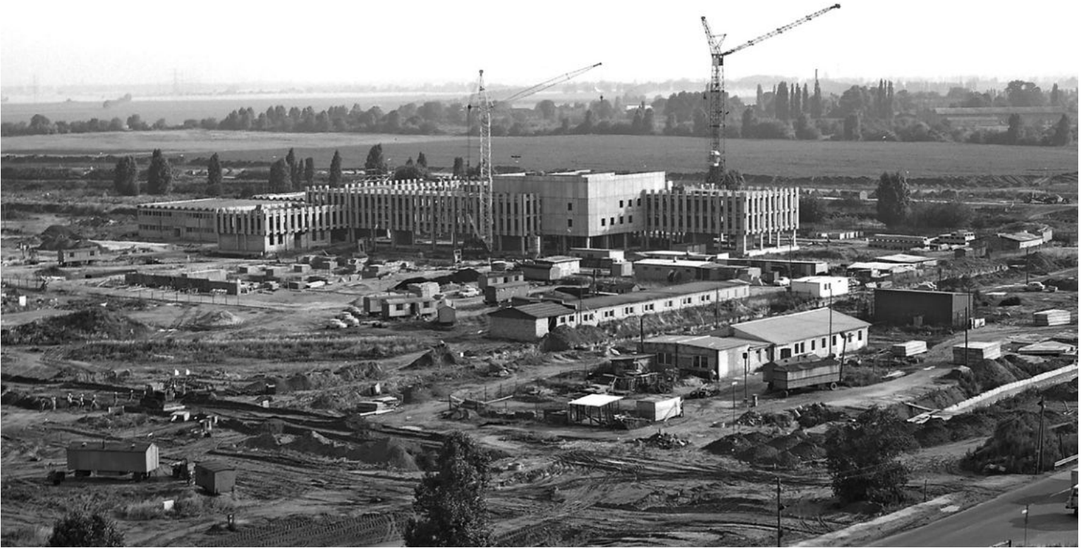
Bau des ehemaligen Handelshauses am Prerower Platz, das am 26.09.1985 eröffnet wurde