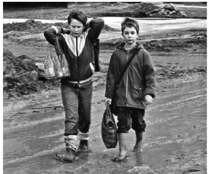
Gummistiefel: damals Hohenschönhauser Standard-Schuhwerk