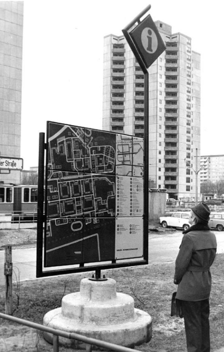
Aushang des Bauplans in der Ahrenshooper Straße