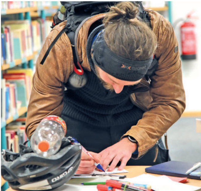
Jede Anregung ist willkommen

Kommt man in eine Zirkusmanege, erzeugt das sofort Bilder: Akrobat*innen auf dem Hochseil, im Kreis laufende Elefanten, das Vordertier jeweils mit dem Rüssel am Schwanz fassend, grell geschminkte Clowns, die Unwahrscheinliches aus irgendwelchen Kisten zaubern. Wir sind in der Wartenberger Straße 175, beim Kinder- und Jugendzirkus Cabuwazi. Ein Ort, an dem normalerweise Kinder und Jugendliche aus Hohenschönhausen trainieren und regelmäßig Shows stattfinden. Am 12. Oktober 2022, stehen allerdings keine Artist*innen unter der kreisrunden Zeltkuppel. Hier findet die Auftaktveranstaltung für das neue städtebauliche Zentrum Neu-Hohenschönhausens statt. Jeder ist herzlich willkommen, ganz besonders natürlich die Nachbar*innen.